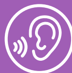
Ваші слухові апарати