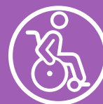
Ваше медичне обладнання