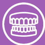
Ваші зубні протези