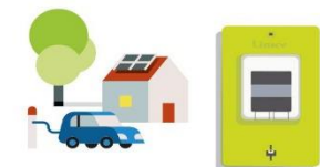
LE COMPTEUR LINKY

enregistre la consommation quotidienne et globale de votre foyer en kWh